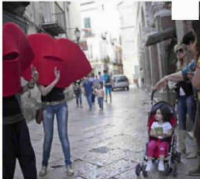
Festival Del Bacio

Presso Sant'Agata dei Goti (BN) Centro Storico,