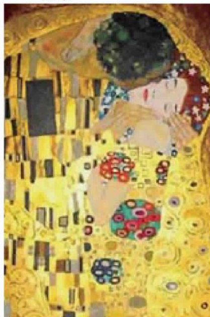
Il celebre «Bacio» di Klimt Sopra, un logo della manifestazione